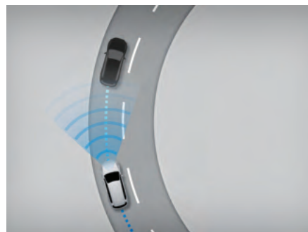
線道維持置中功能 (LTA)