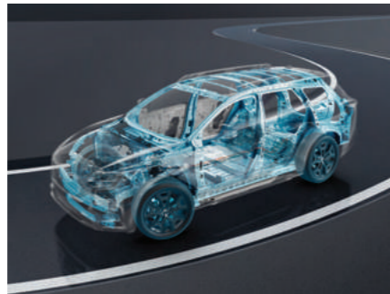
高剛性環形車架設計