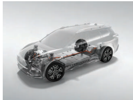
eAxle高效永磁同步電動雙摩打