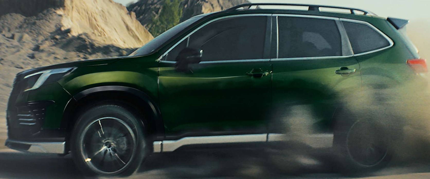
ภาพเพื่อการโฆษณาเท่านั้น | ข้อมูลจำเพาะอาจแตกต่างกันไปตามตลาดแต่ละประเทศ