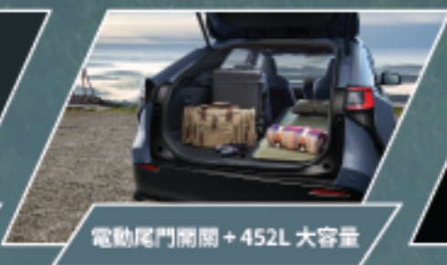
電動尾門開關 + 452L 大容量