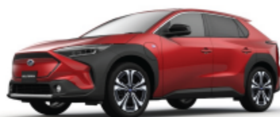
Emotional Red 2