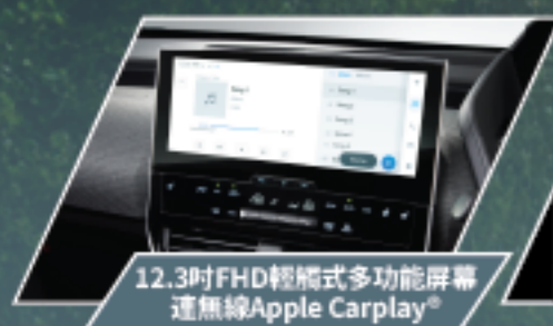
12.3吋FHD輕觸式多功能螢幕 連無線Apple Carplay®