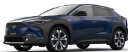
Dark Blue Mica

Subaru 九龍灣旗艦店 九龍灣宏照道17號康大電業大廈地下 電話: (852) 2828-2488