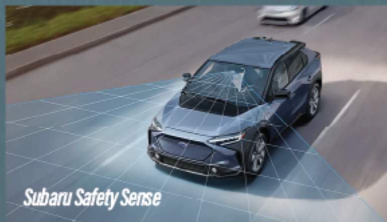
Subaru Safety Sense

*駕駛輔助系統不保證在所有行駛條件下都能完美運作。駕駛者應盡責安心專心地駕駛，並遵守交通法則。系統實際效能取決於多項因素，例如車輛狀況、天氣、路況等。