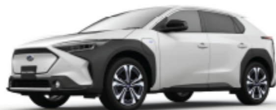
Platinum White Pearl Mica