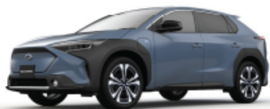
Harbor Mist Grey Pearl