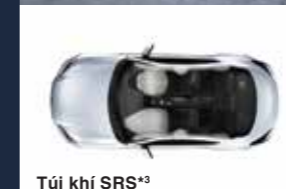
Túi khí SRS*3