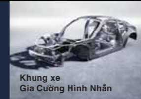
Khung xe Gia Cường Hình Nhân

Cùng với những cải tiến của các công nghệ cốt lõi và khả năng bảo vệ khi xảy ra va chạm, Subaru luôn chú trọng cam kết "An Toàn cho mọi người" khi không ngừng phát triển triết lý thiết kế An Toàn Toàn Diện và hướng đến một tương lai không có tai nạn giao thông xảy ra.